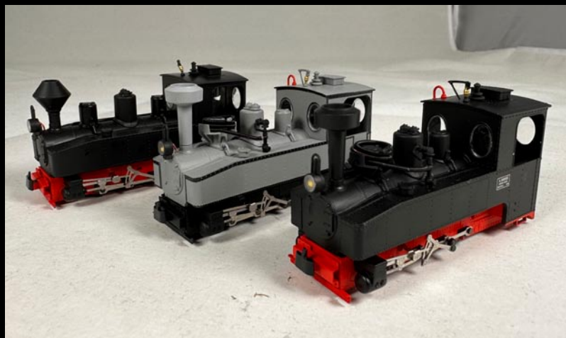
Heeresfeldbahn-Lokomotiven 1026, 1022 und 1021

After a rather long time we have decided to re-run a few items that are partially now back in stock. Our prices are slightly increased what was unavoidable. The items are available in limited quantities, so do not delay your decision to acquire what you always wanted.